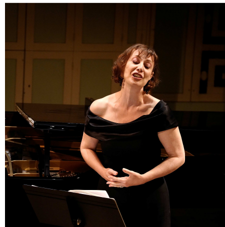
Concert d'Adventura à la salle Molière à Lyon