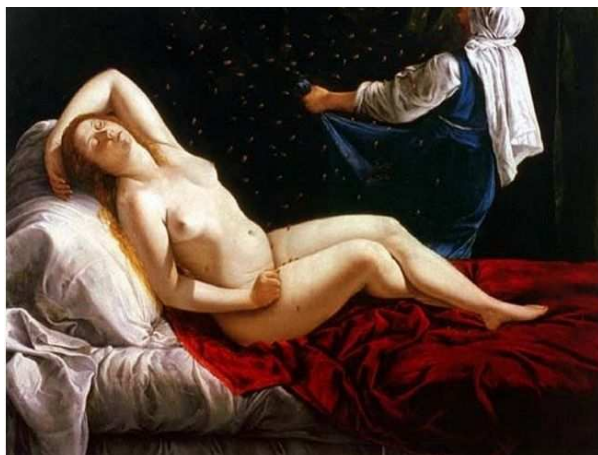
Danae, un tableau d'Artemisia Gentileschi (1612)