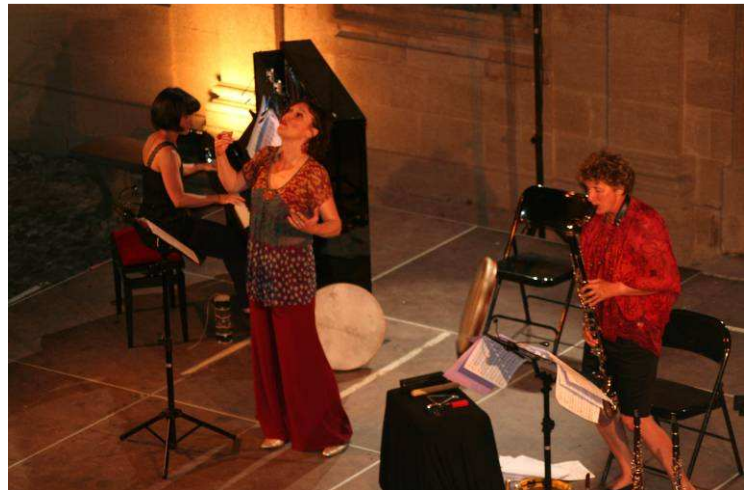
20 juillet 2010, cour de l'Hôtel de Ville à Aix : les Escales Songs du Trio Adventura

E-mail : vuillermet.jg@wanadoo.fr - Blog : http://adventuratrio.skyrock.com