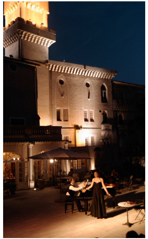
Un duo en harmonie avec le lieu.

Airs d' Offenbach , de Messager , de Strauss , mélodies de Poulenc , de Sauguet (Cabaret 1900-1920, inspiré du répertoire des chanteuses Hortense Schneider, Paulette Darty, Yvonne Printemps...).